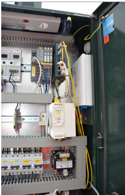
Måler plassert i fordelingskap.

Måleren er ofte plassert i en fordelingsstavle (skap). Her ligger gjerne også overspenningsvern, overbelastningsvern(automatsikringer) og mange andre typer utstyr.