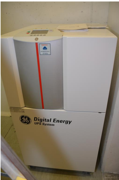
Stor UPS.

Bildet viser en stor UPS (Nødstrømforsyning) fra Hovedfordeling til Strindheimtunnelen i Trondheim.