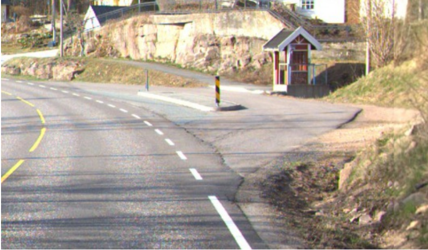
Eksempel 2. Trafikklorne - bruksområde busslorne