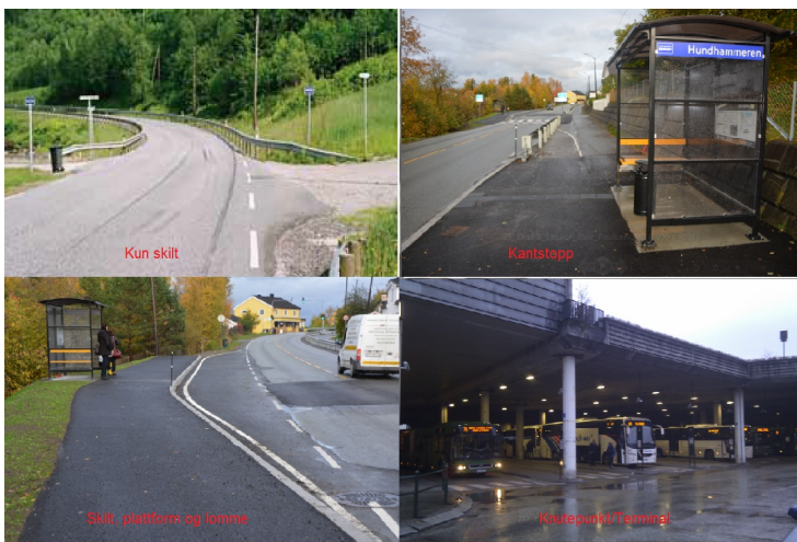
Typer av holdeplassutrustning

Bildet viser eksempler på typer Holdeplassutrustning. UU_Type : er definert slik her og i håndbok V123: