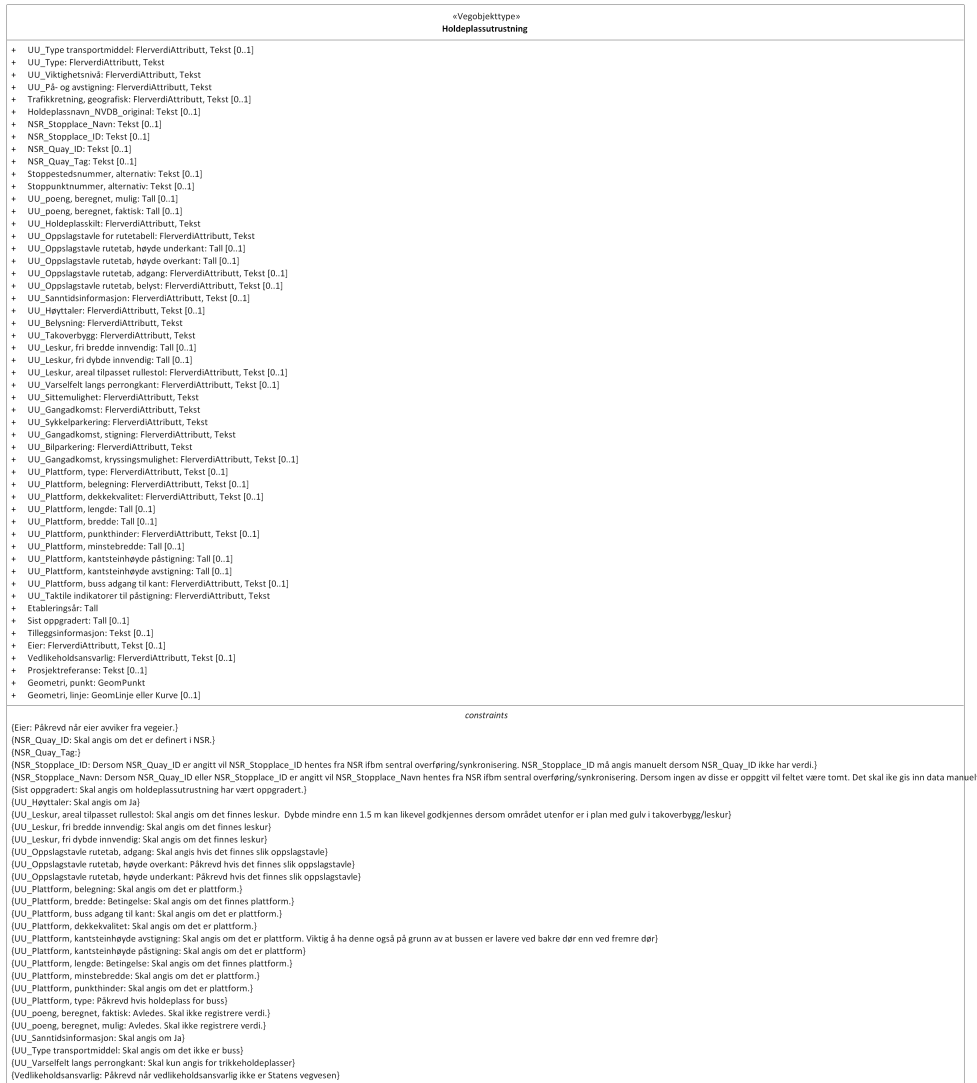
Figur 1:UML-skjema med betingelser