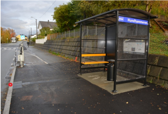
Geometrireferanse for objektet