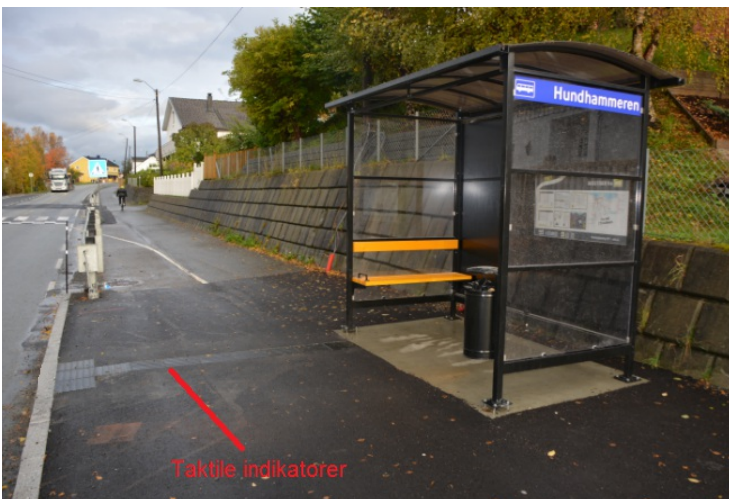
Taktile indikatorer ved busstopp.

Bildet viser eksempler på taktile indikatorer på en Holdeplassutrustning