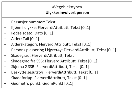
Figur 1: UML-skjema for Ulykkesinvolvert person