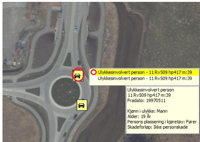
Figur 3: Data for en ulykkesinvolvert person

Her vises data for den ene av to ulykkesinvolverte personer i en ulykkesinvolvert enhet