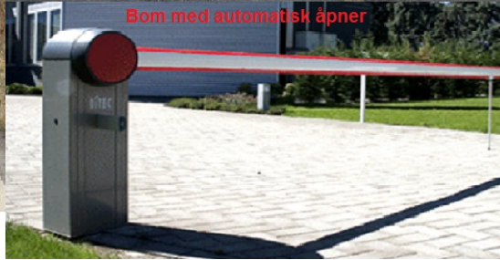
Bom med automatisk åpner