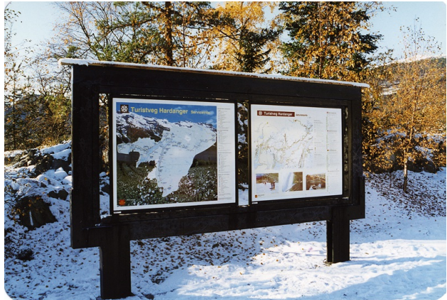
Stativ for turistinfo i Hardanger.

Antall infoplater : 2 Belyst : Nei Fundamentering: Stolpefundament Materialtype: Metall Overflatebehandling: Ubehandlet Plexiglass utenpå infoplater: Nei Stedsangivelse: Stegabakken Tak: Nei