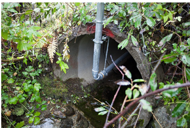
Figur 5:

Antall tininger : 5 Bruksområde : Vann Diameter, innvendig : 800 mm Fundamentering : Pukk Gjennomløp for elv/bekk : Ja Har innløpsrist : Nei Helning/Fall : 1:15 Etableringsår : 2003 Lengde : 12 m Materialtype : Betong Overfylling innløp : 0.4 m Overfylling utløp : 0.35 m Prefabrikkert : Ja Produktnavn, rør : Retning : 3 Spesielle hensyn fiskevandring : Nei Spesielle problem : Masser innløp Tilknyttet lukka dren : Nei Tverrsnittsform : Sirkulær Tykkelse overfylling : 0.6 m Type innløp : Åpen i grøft Type utløp : I bekk/elv Varmekabler : Ja Vinkel : Rett