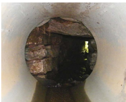
Figur 8: Stikkrenne som er forlenget

Her vises en gammel stikkrenne av murt stein som er forlenget med et betongrør.