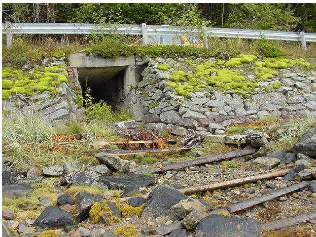
Figur 6: Stikkrenne.

Stikkrenne (naust) under RV 720 Mellom Verrabotn og Follafoss i Nord-Trøndelag