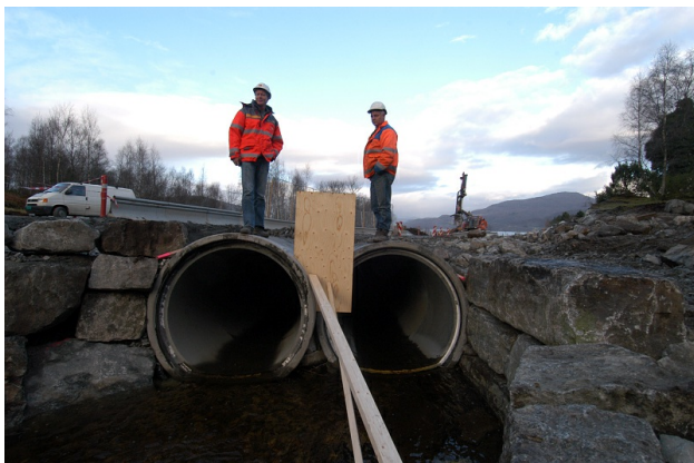
Figur 4: Foto Geir Brekke

Antall tininger : 2 Bruksområde : Vann Diameter, innvendig : 800 mm Fundamentering : Pukk Gjennomløp for elv/bekk : Ja Har innløpsrist : Nei Helning/Fall : 1:20 Etableringsår : 2006 Lengde : 8 m Materialtype : Stål Overfylling innløp : 0.3 m Overfylling utløp : 0.35 m Prefabrikkert : Prefabrikkert Produktnavn, rør : Retning : 9 Spesielle hensyn fiskevandring : Uavklart Spesielle problem : Vegetasjonstetting, innløp Tilknyttet lukka dren : Nei Tverrsnittsform : Sirkulær Tykkelse overfylling : 0.3 m Type innløp : Åpent i grøft Type utløp : I bekk/elv Varmekabler : Nei Vinkel : Rett