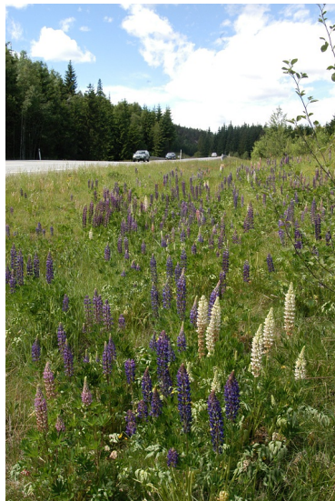
Hage Lupiner.