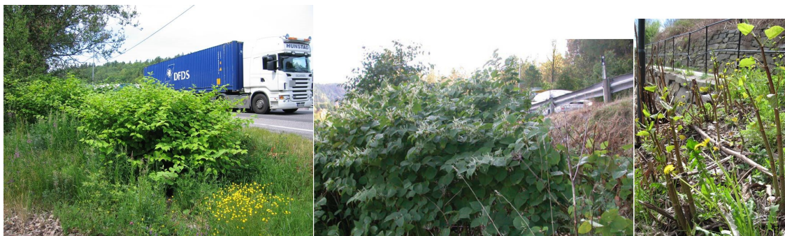
Park- og hybridlirekne.

Park- og hybridlirekne (Fallopia japonica)