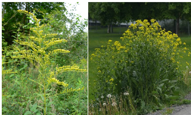
Kanadagullris og russekål