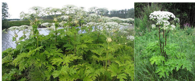
Tromsøpalme og kjempebjørnekjeks.

Artsnavn : Tromsøpalme / Kjempebjørnekjeks Areal : 8 / 1 Antall individ : 8 / 1 Bestandsbredde : 3 / 1 Bekjempelse, type : Kantklipp / Kantklipp Bekjempelsesgrad : Bekjempes / Bekjempes Forekomst fortsetter på naboeiendom : Ja / Nei Forekomst nr : 7 / 2 Registrert dato : 20140815 Tetthet : Tett bestand / Få