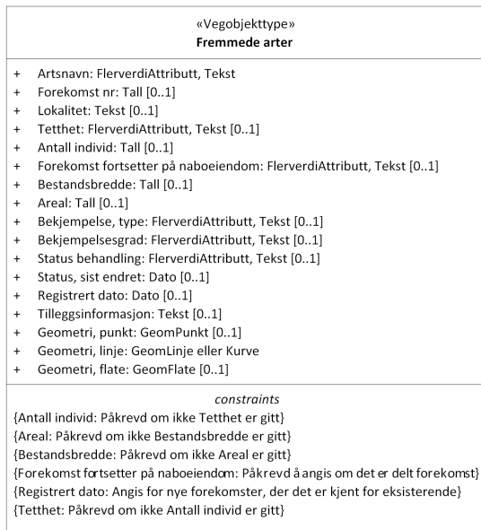
Figur 1:UML-skjema med betingelser