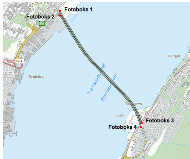
Streknings-ATK i Tromsøundet. Strekning registreres fra første til andre fotoboks i en retning.

Strekning 2 definert av fotoboks 2 og 4: E8 Hp07 10940-12988 Sted: Stakkevollan-Tomasjord Kontrollretning: Med metreringsretning