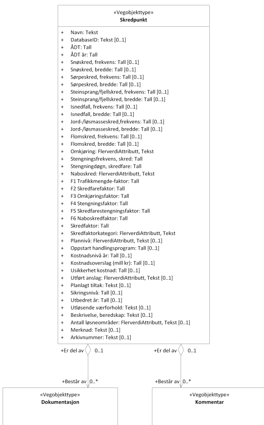
Figur 3: UML-skjema med assosiasjoner