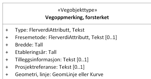
Figur 3: UML-skjema med assosiasjoner