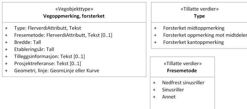
Figur 2:UML-skjema tillatte verdier