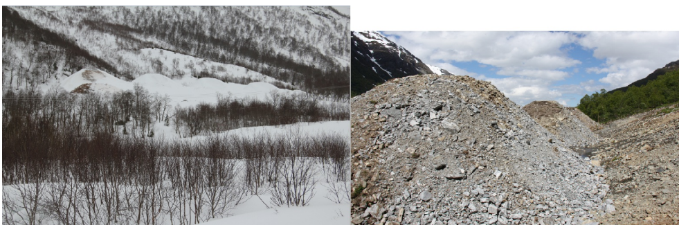
Figur 3: Eksempler på bremsekjeger.