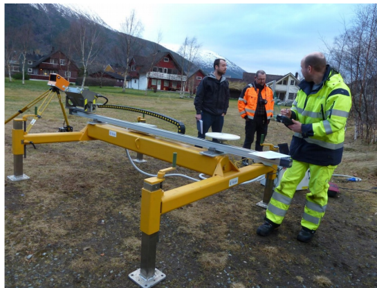
Figur 3: Utstyr for skredvarsling med radar

Eksemplet viser utstyr for skredvarsling basert på radar. Enheten har også tilknyttet GPS og laserscanner.