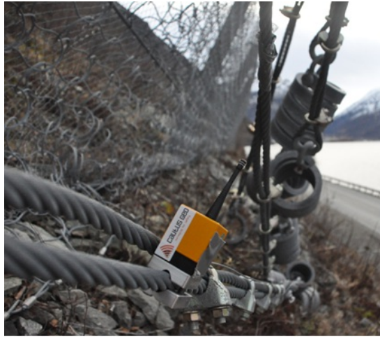
Figur 4: Rystelsesmåling på fanggjerde.

Type naturfare: Steinsprang/skred Overvåkningstype: Rystelsesmåling Varsling på veg: Ingen Adkomst : Kran