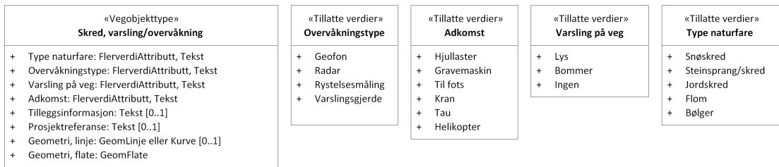
Figur 2: UML-skjema tillatte verdier