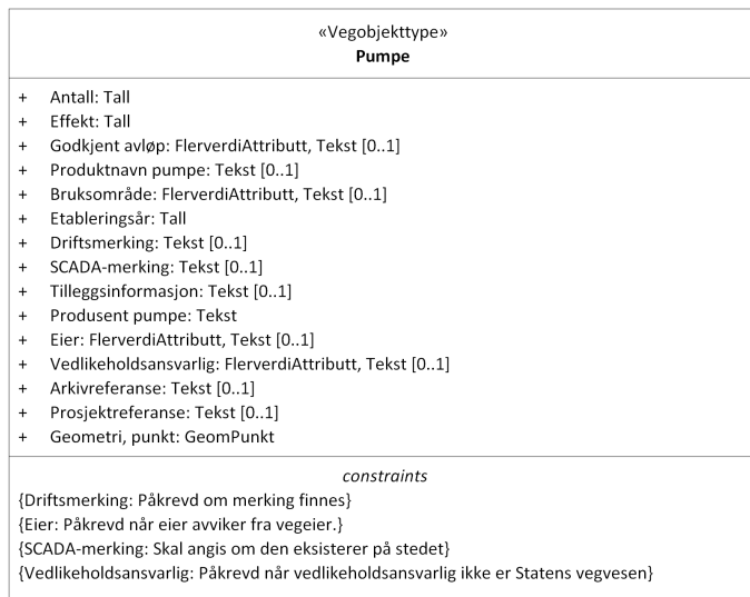
Figur 1: UML-skjema med betingelser