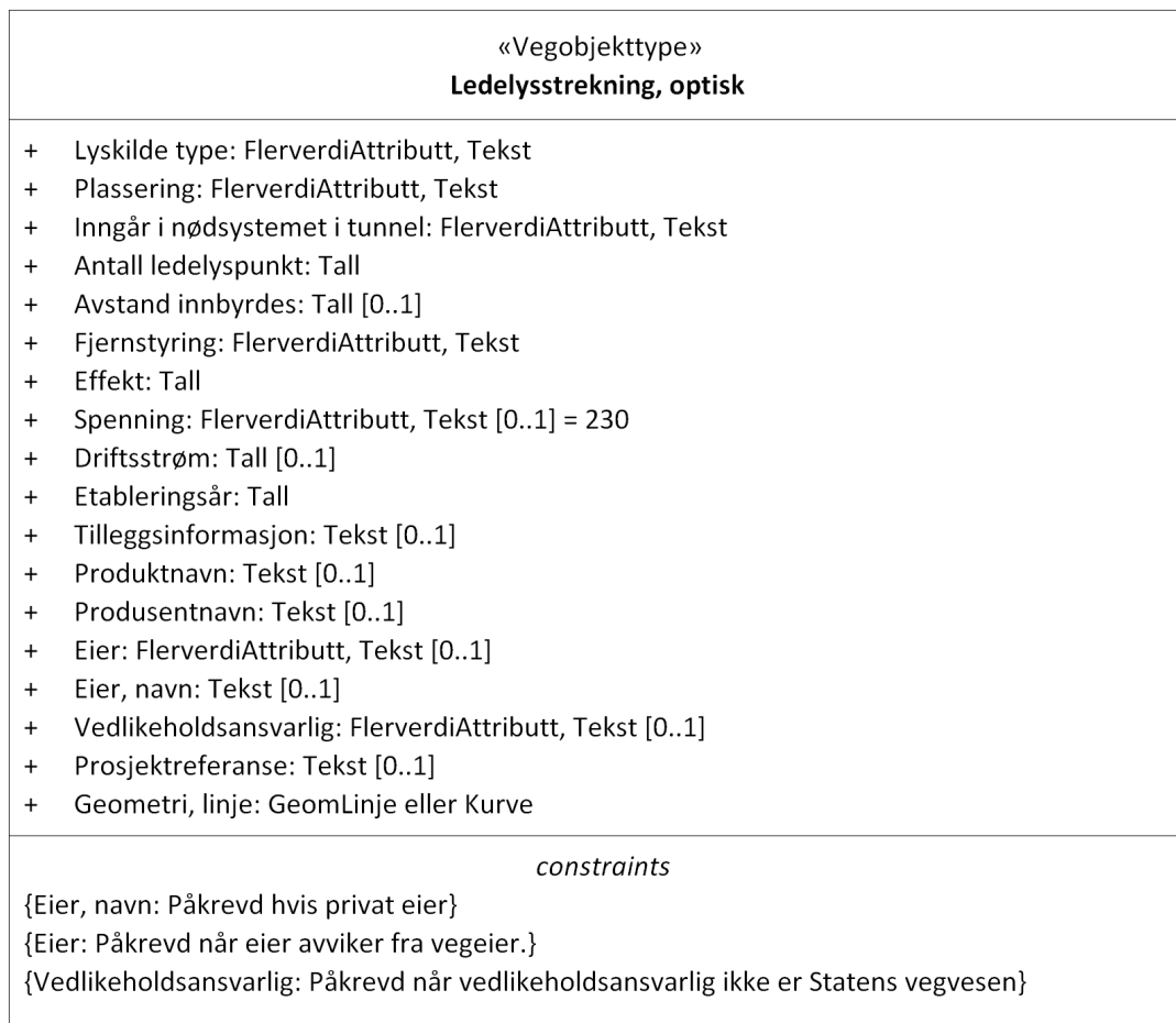
Figur 1: UML-skjema med betingelser