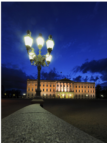
Lyssetting av område

Bildet viser en lysmast med 5 vakre lysarmaturer plassert for å lyse opp plassen foran det kongelige slott i Oslo