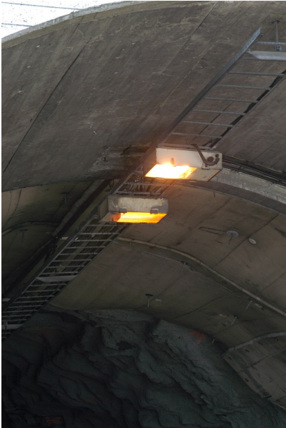
Lysarmaturer i Tunnel.

Bildet viser en eldre tradisjonell lyssetting av tunnel der lysarmaturene er festet til en kabelstige i taket på tunnelen