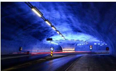
Lyssetting i Vallaviktunnelen.

Bildet viser eksempel på en moderne og litt spektakulær lyssetting i en rundkjøring i Vallaviktunnelen. For å kunne skille ut effektbelysning kan det være lurt å registrere noen av de opsjonelle egenskapene som Fargetemperatur