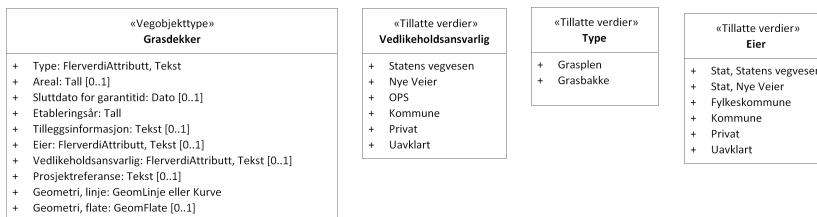
Figur 2: UML-skjema tillatte verdier