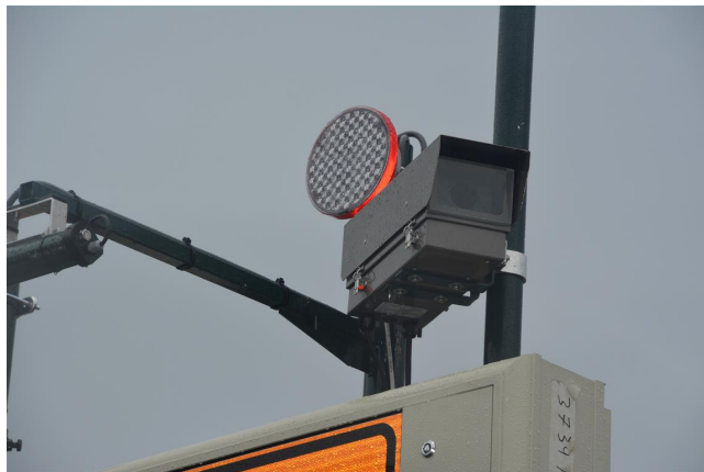
Luminansmåler utenfor tunnel.

Bildet viser en luminansmåler plassert utenfor Strindheimtunnelen i Trondheim