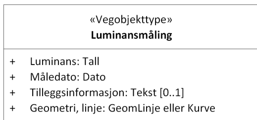
Figur 1: UML-skjema med betingelser