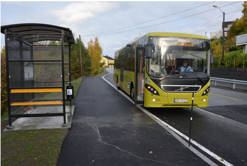
Figur 5: Eksempel på plattform ved busslomme (Hundhammeren i Malvik kommune).

Areal: 100 Belegning: Asfalt Bredde: 2,5 Lengde : 40 Type: Plattform