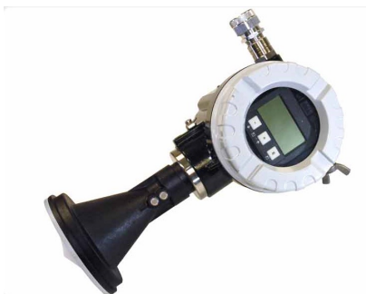
Vannstandsmåler med radar. Foto: Waterlog

Bruksområde : Vannstand Driftsmerking : xxxxx Etableringsår : 2010 Produktnavn : H-3611-S SDI-12 (opsjonell) Produsent : Waterlog (opsjonell) Type : Radarsensor (opsjonell)