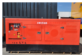
Stasjonært strømaggregat.