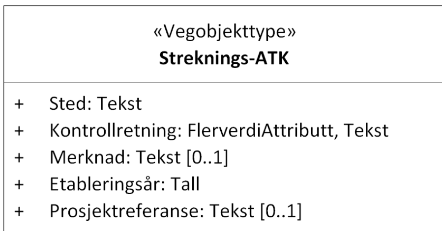
Figur 1: UML-skjema