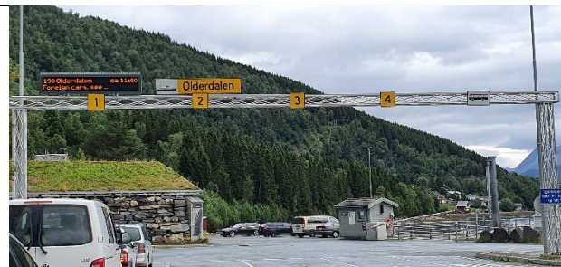
Annen stolpe (17267)