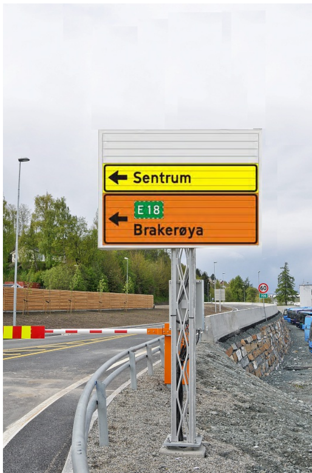
Bildet viser et prismeskilt som normalt kan ha inntil 3 budskap. Foto: Knut Opeide og Håndbok V321 (053)

Ansiktsside, rettet mot : Trafikk i metreringsretning Antall ansikt (inkl av) : 2 Arkivnummer : 201005382-34 Belyst : Nei Beskrivelse : Viser omkjøring til Brakerøya og E18 ved stengt bru Fjernstyring : Ja Etableringsår : 2008 Plasseringskode : 30 $0$ : Automatisert/elektrisk $0$ : 713.V - Vanlig vegviser, Venstre $0$ : @711.V90@@723.12@$0$Brakerøya $0$ : Mekanisk $0$ : Et motiv på/av $0$ : xxxxx