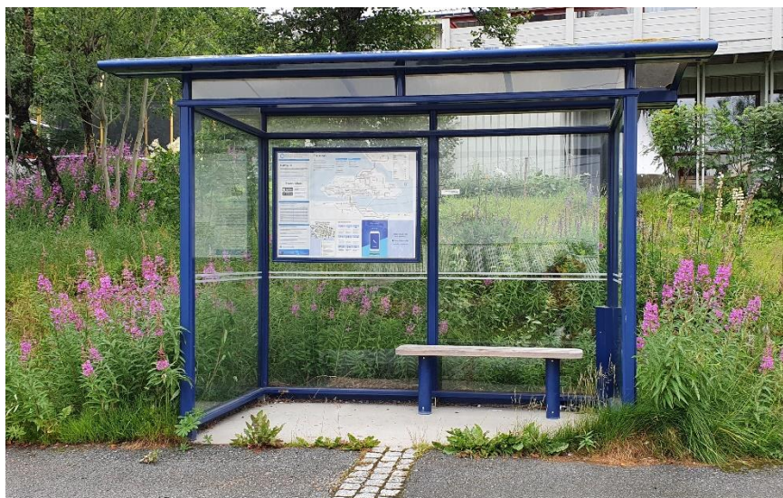
Figur 1 Leskur