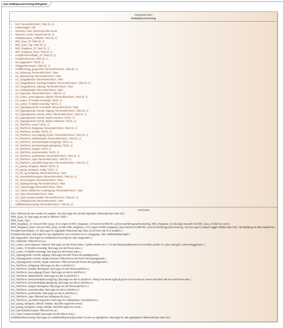
Figur 1:UML-skjema med betingelser