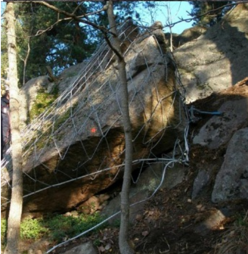
Øverst "Ubåtnett", nederst wirenett