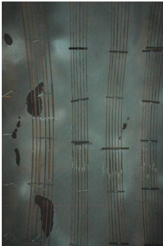
Bilde fra tek-rapport 2538

Areal : 200 Etableringsår : 2008 Lengde : 10 Plassering : Tunnel, høyre vegg Type : Sprøytebetongbuer, enkel Type sprøytebetong : Uarmert Tykkelse sprøytebetong : 6