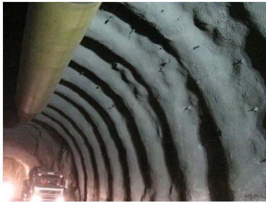
Bilde fra tek-rapport 2538

Areal : 700 Etableringsår : 2008 Høyde over veg : 3 Lengde : 30 meter Plassering : Tunnel, hele profilet Type : Sprøytebetongbuer, dobbel Type sprøytebetong : Uarmert