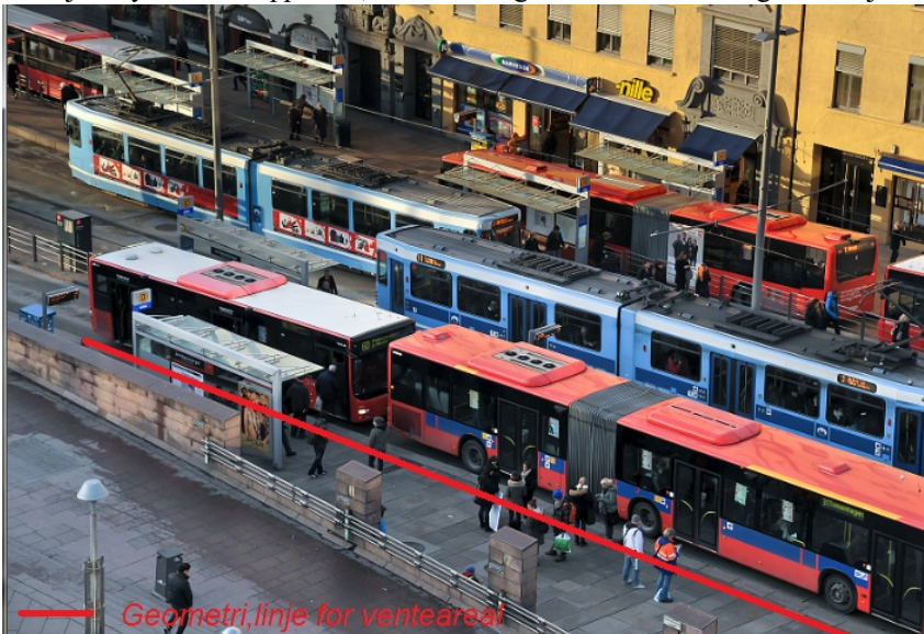
Figur 6: Flere Repos/Venteareal på kollektivknutepunkt

Der det er mange Stoppunkter på et lite område, må det registreres et Repos/Venteareal for hvert separate område. Reposene bør være like lange som kjøretøyene som stopper der, alternativt lengre dersom det er vanlig at flere kjøretøy stopper der samtidig.