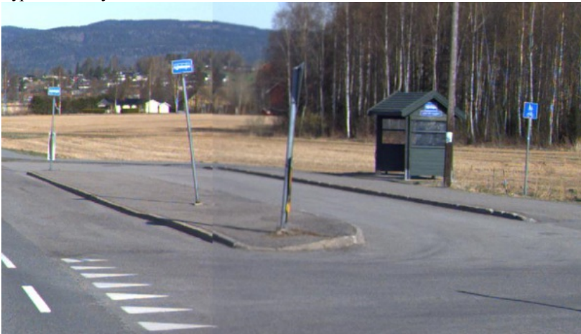
Figur 4: Eksempel på repos/venteareal på ensidig busslomme