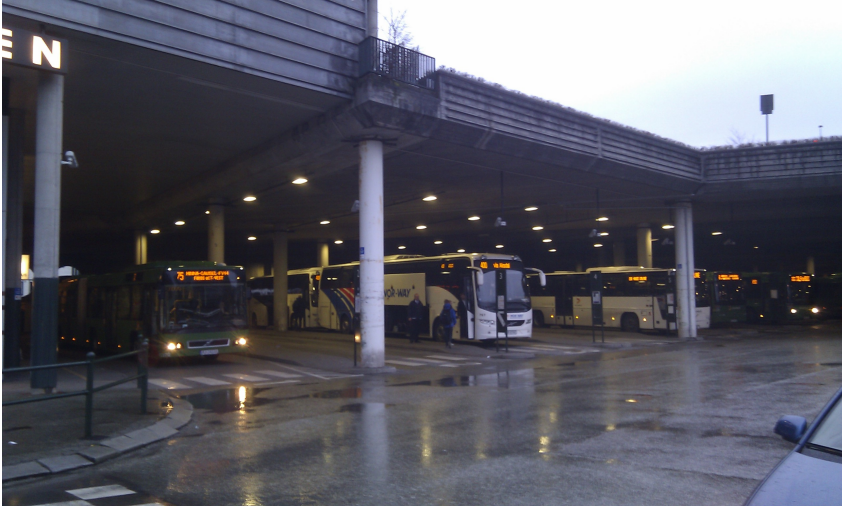
Figur 3: Repos/Venteareal på kollektivterminal

Bildet viser flere venteområder under tak i kollektivterminal.