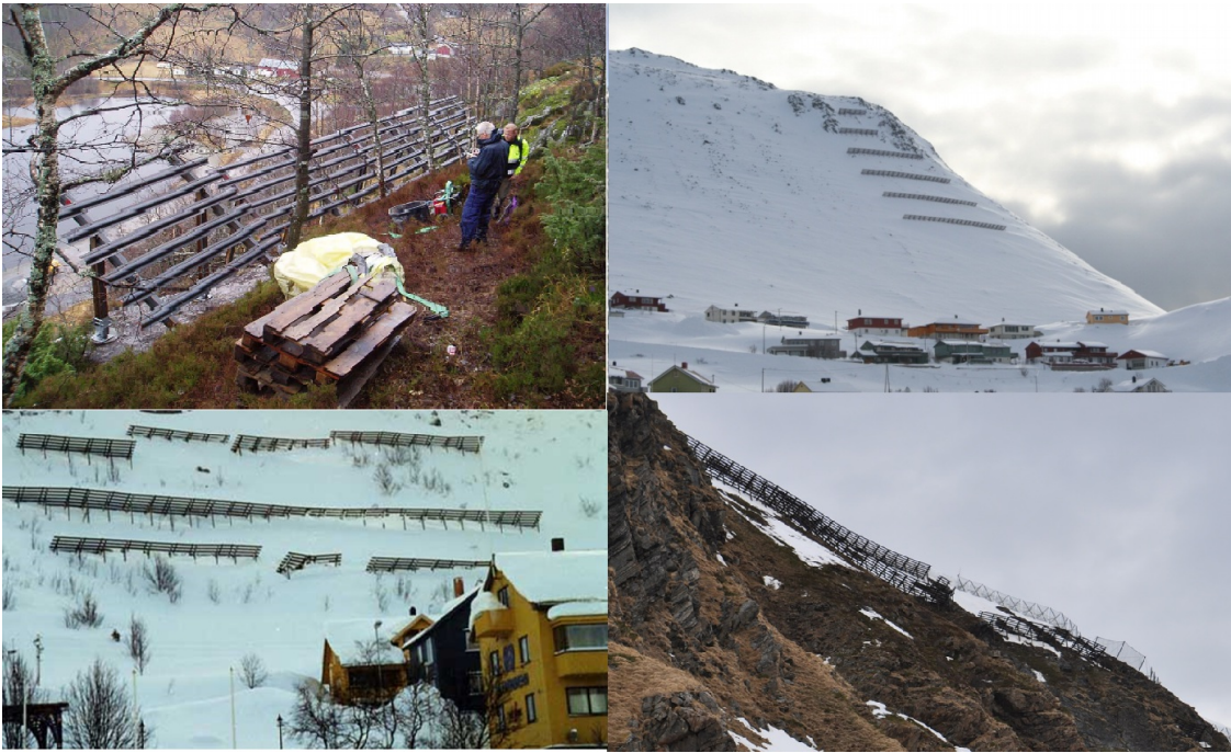
Eksempler på støtteforbygninger.