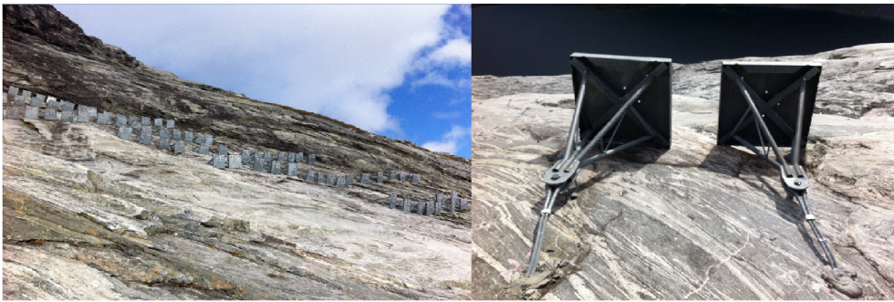
Eksempler på bruk av snøanker.