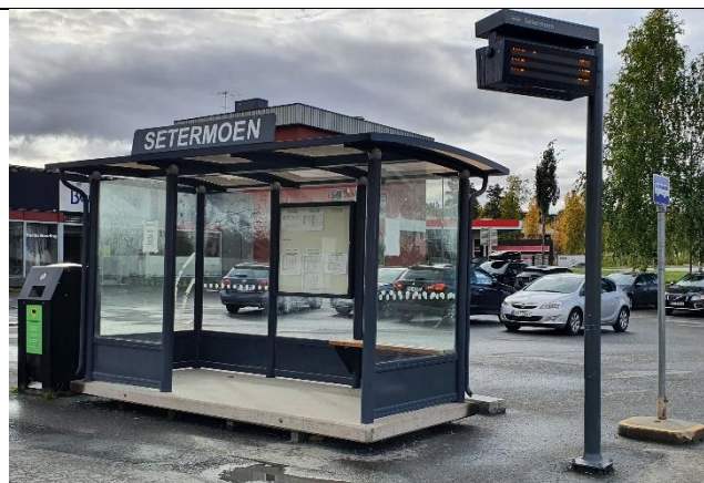
Eget oppsettingsutstyr (17265)