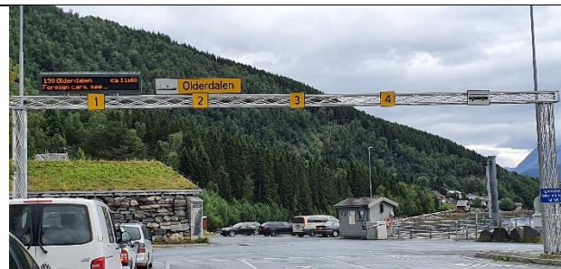
Annen stolpe (17267)