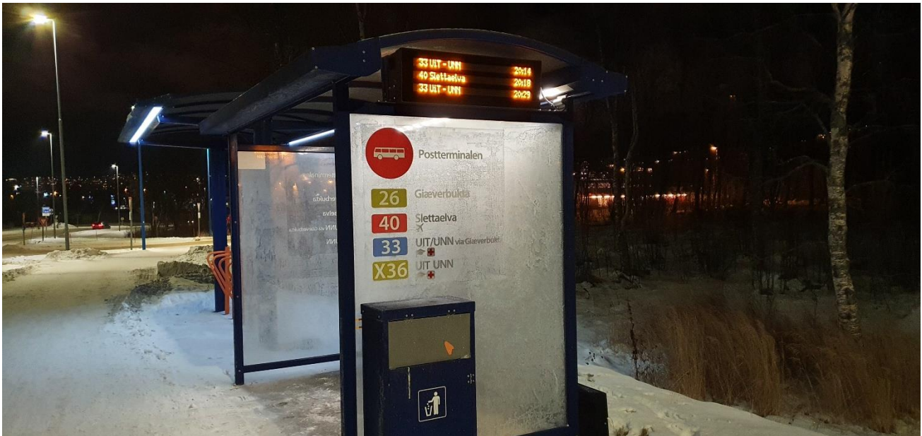
Figur 1 Sanntidsinformasjon, kollektivtrafikk