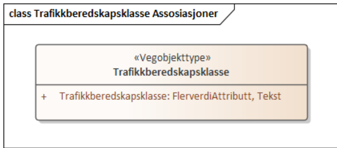
Figur 3: UML-skjema med assosiasjoner