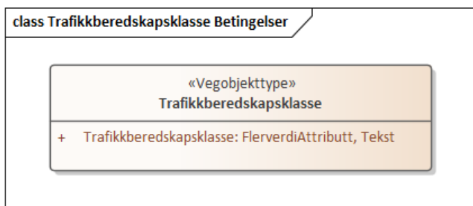
Figur 1:UML-skjema med betingelser