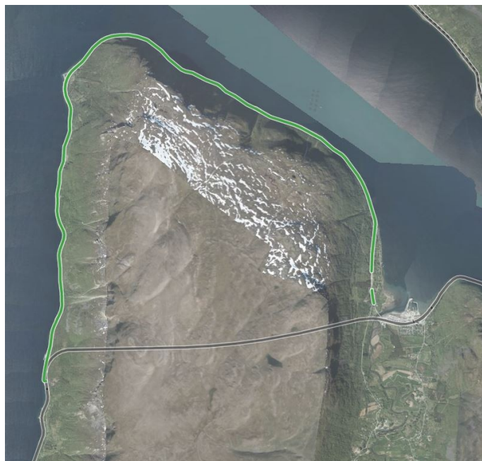
Vegmyndighet kan bli endret E6 Nordnesfjellet