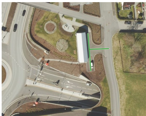
Figur 1 Serviceveg ved rv. 13 Hundvåg tunnelen