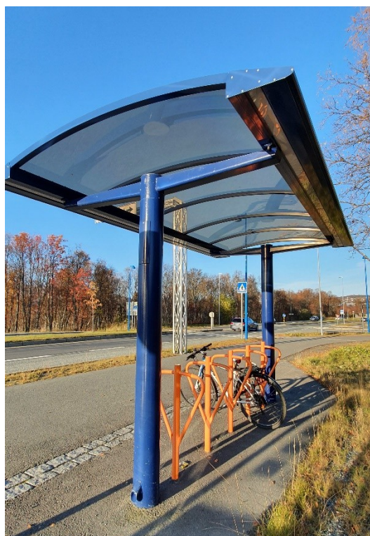
Figur 1 Sykkelparkering