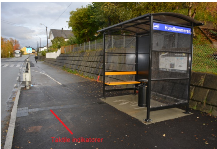
Taktile indikatorer ved busstopp.

Bildet viser eksempler på taktile indikatorer på en Holdeplassutrustning