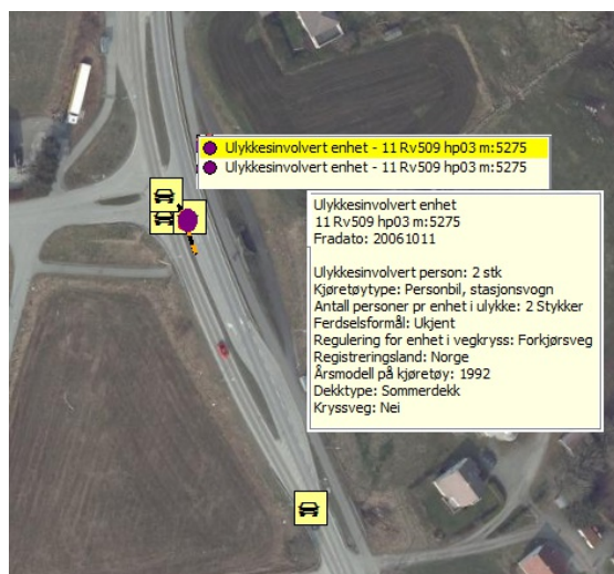
Figur 3: Data for ulykke med 2 ulykkesinnvolverte enheter

Eksemplet viser data fra en trafikkulykke med to enheter involvert i ulykken. Vi ser her at det er to personer involvert i den ene bilen, og disse vil da finnes igjen som ulykkesinnvolvert person.