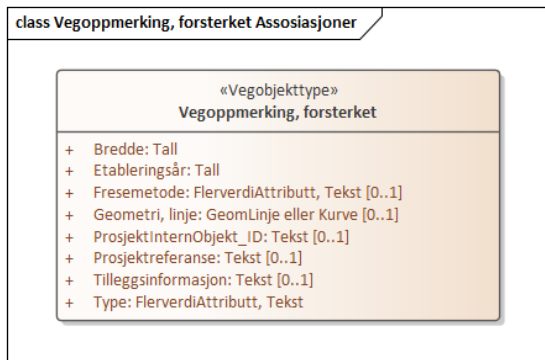
Figur 3: UML-skjema med assosiasjoner