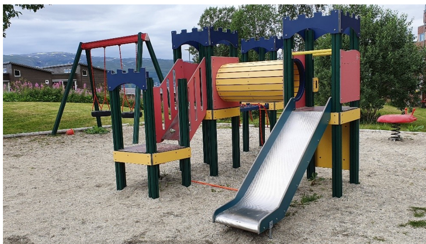
Figur 1 Lekeapparat