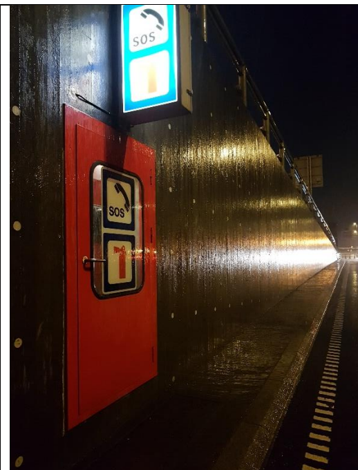
Innfelt skap i Lørentunnelen