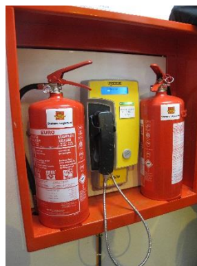
Figur 1 Nødstasjon

NB! Dette er en høringsutgave. Det kan bli mindre justeringer. Endelig versjon forventet rundt 15/4-24.