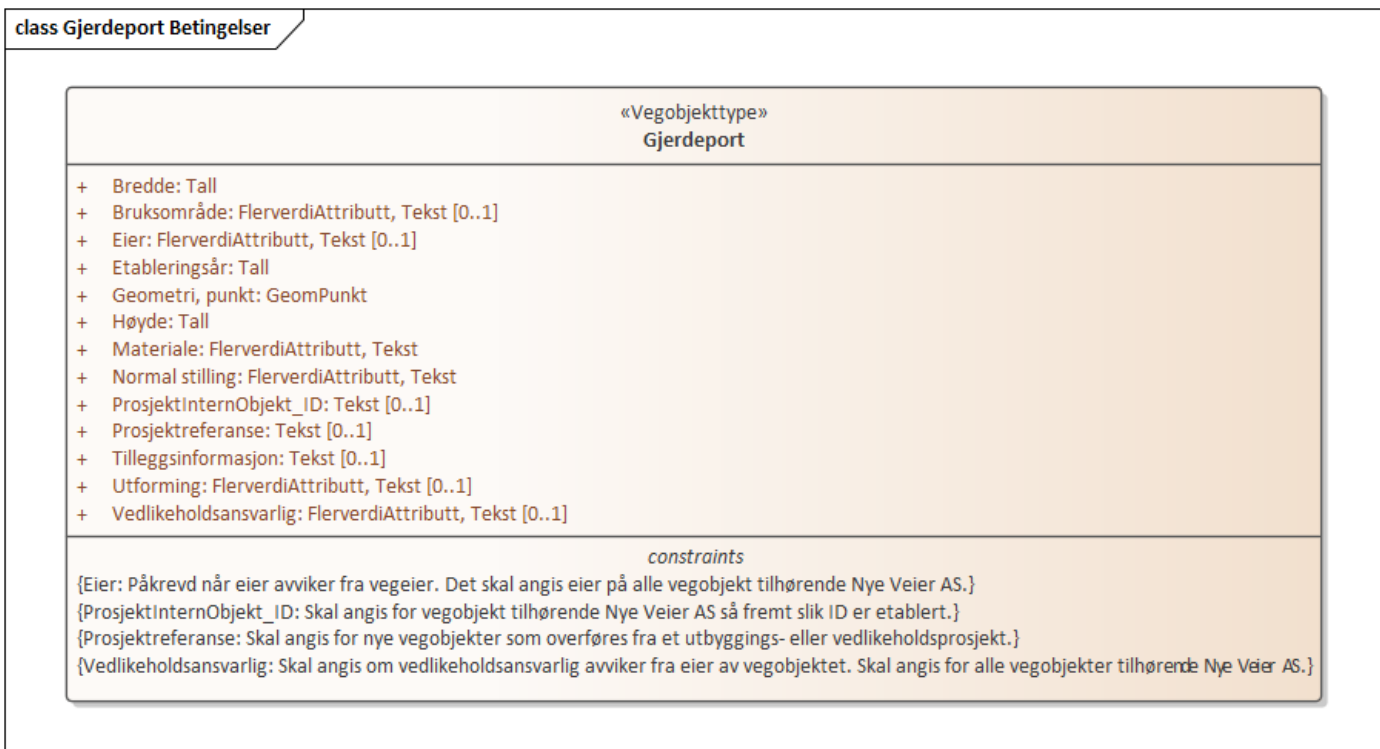
Figur 1: UML-skjema med betingelser